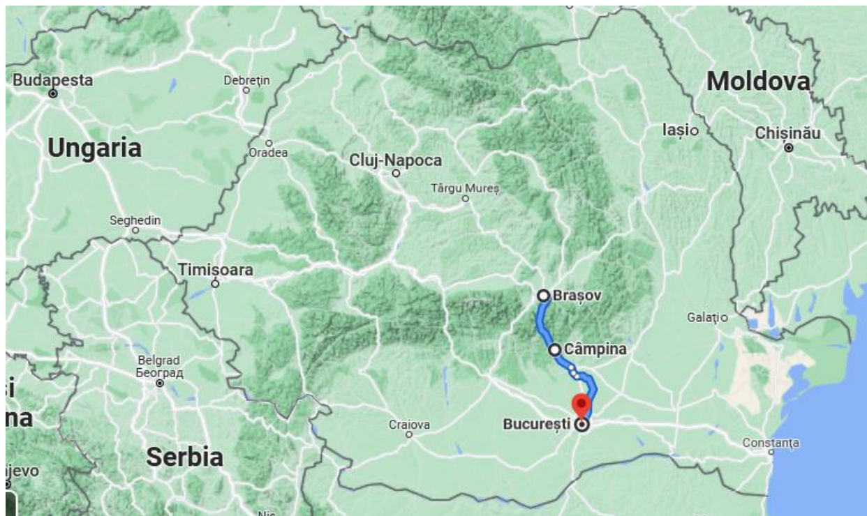
Figura 1. Traseul Drumului Național 1

condițiile geomorfologice, pedologice, climatice și de vegetație. Astfel, sectoarele cuprinse între km 39,5 - 44,0 și 57,0 - 63,0 sunt situate în Câmpia Munteniei de Est, iar sectorul dintre km 71,0 - 79,0 este poziționat în Subcarpații Prahovei (parte componentă a Subcarpaților de Curbură [30]).